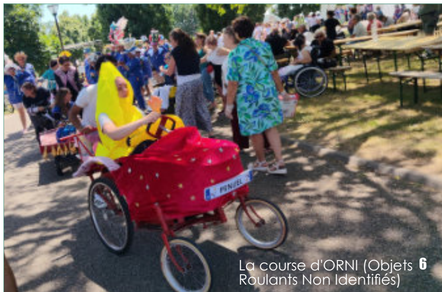
La course d'ORNI (Objets Roulants Non Identifiés)