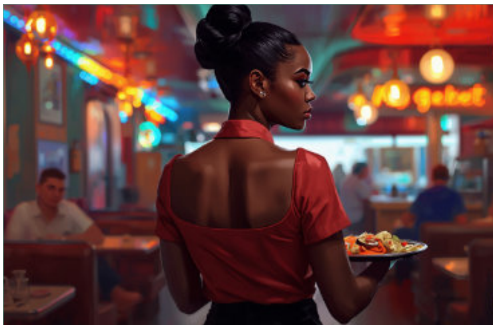
Photo d'illustration générée par IA

Ces stages m'ont beaucoup plu, surtout pour le contact humain. À la fin de ma dernière année en MFR, j'ai obtenu mon BEPA Ser-