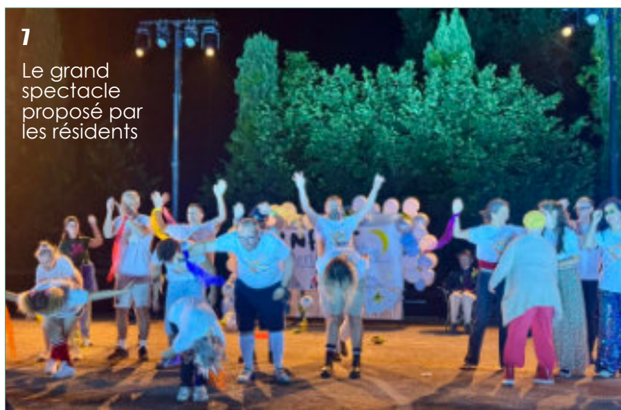
Le grand spectacle proposé par les résidents