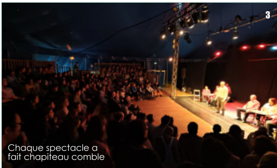
Chaque spectacle a fait chapiteau comble