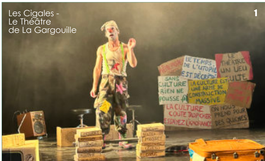
Les Cigales - Le Théâtre de La Gargouille