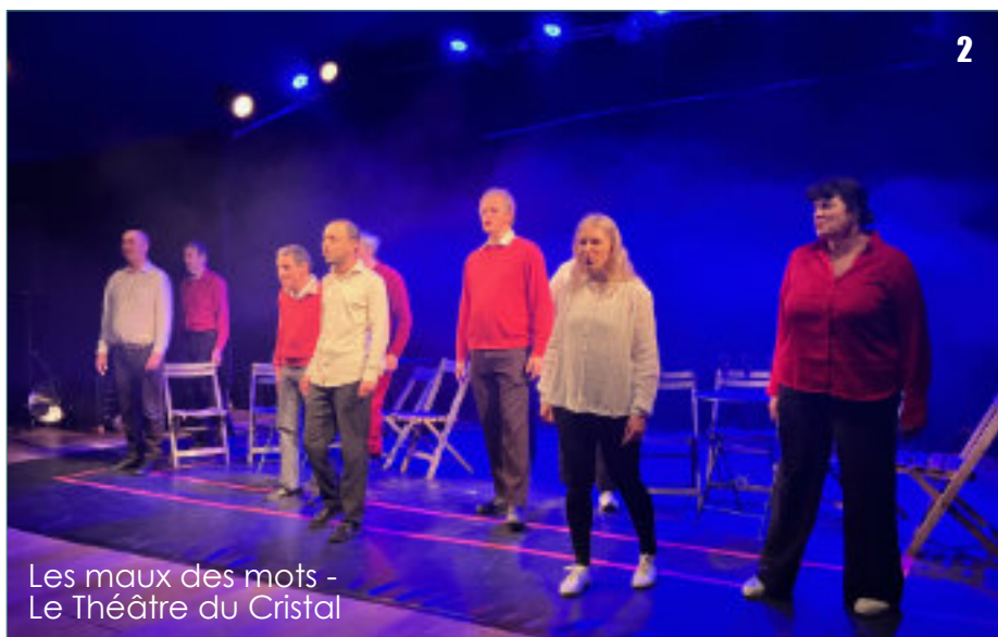
Les maux des mots - Le Théâtre du Cristal